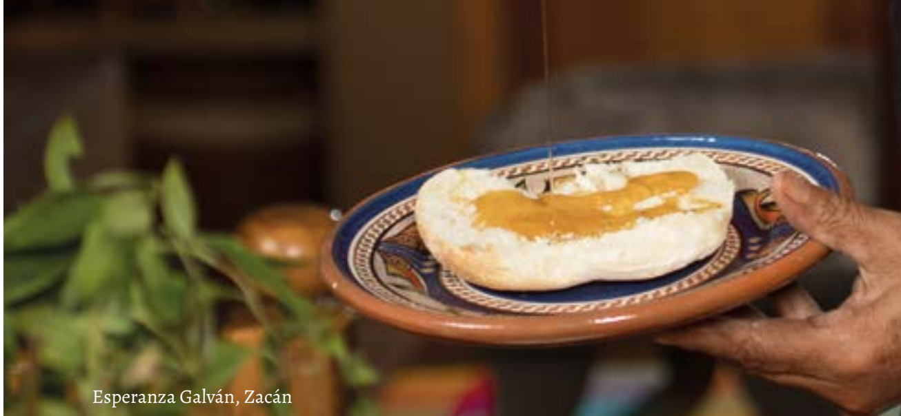
Esperanza Galván, Zacán

M ichoacán se identifica por su cocina, por sus sabores étnicos mezclados con otras culturas. Aquí hay sitios y platillos para todos los gustos: regionales, tradicionales, mexicanos e internacionales.