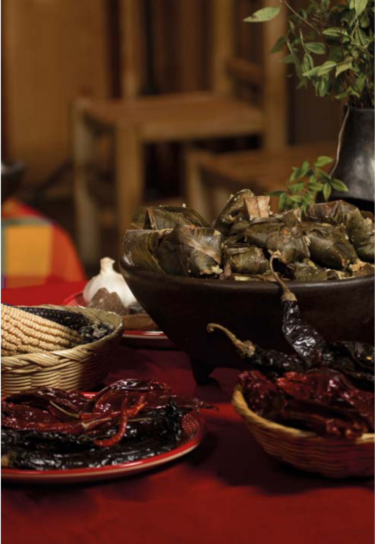
Esperanza Galván, Zacán