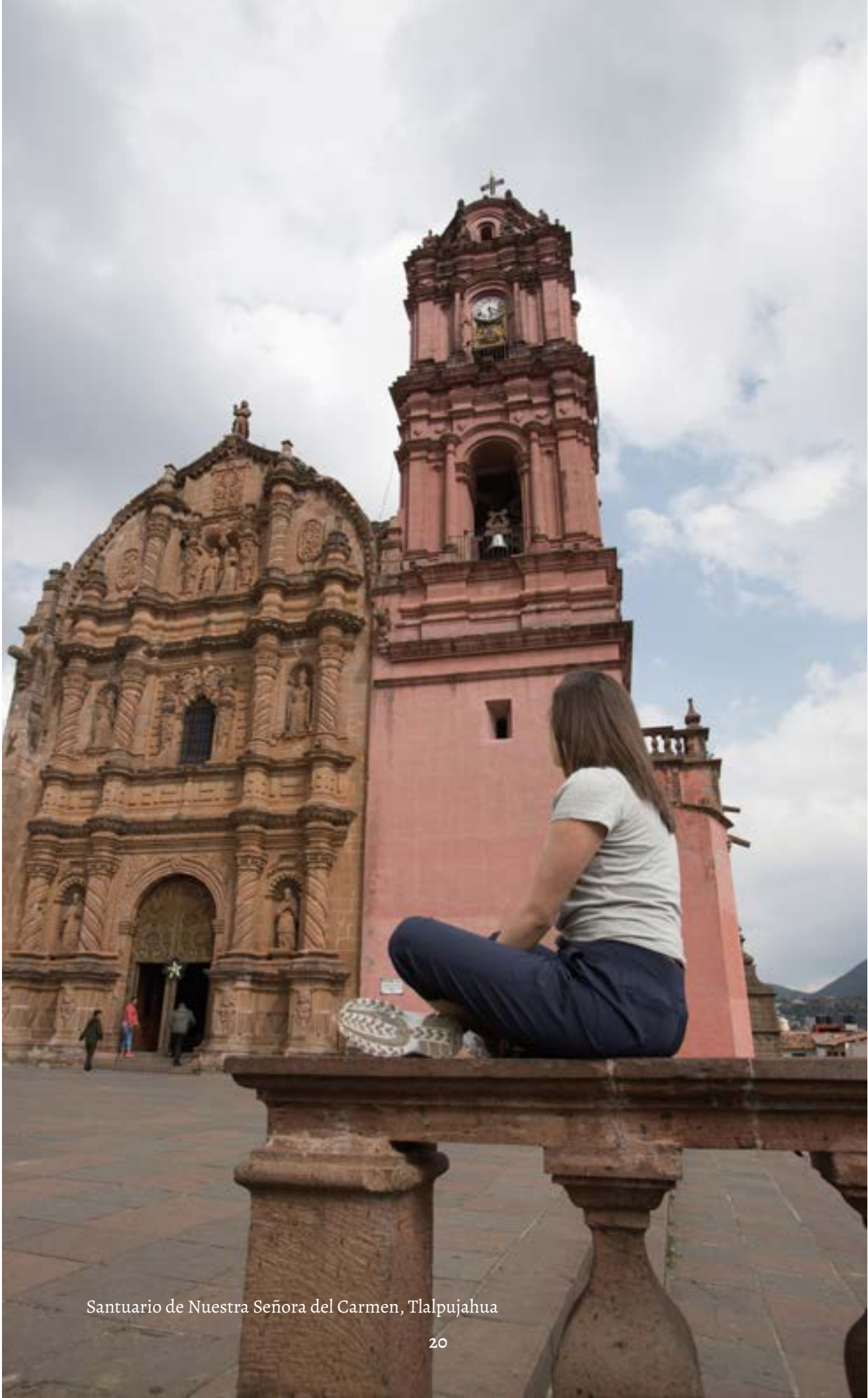
Santuario de Nuestra Señora del Carmen, Talpujahuá